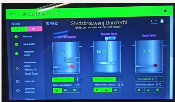
Het controlepaneel van de HERMS.

We hebben er alle vertrouwen in dat het onze brouwmeester(s) lukt om de Herms volledig inzetbaar te krijgen voor het brouwen van onze lekkere Schapenkopjes.